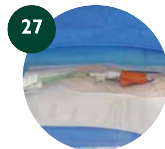
27 Colocación PICC