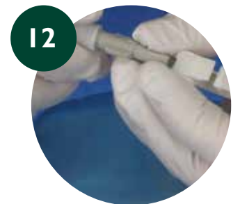
12 Retirar guía interna y la parte externa desmontable del PICC proximal