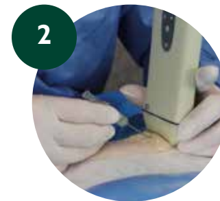
2 Punción ecoguiada