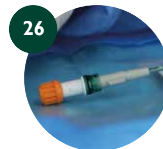
26 Tapón protector