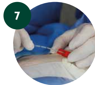
7 Progresión PICC