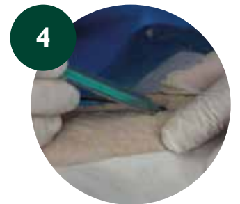
4 Pequeña incisión