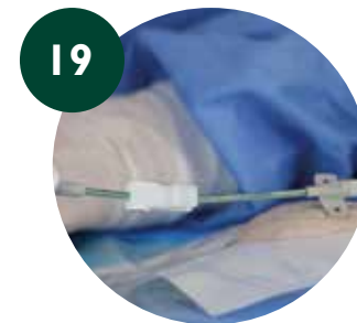
19 Conectar la parte externa desmontable del PICC proximal