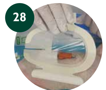
28 Estabilización del PICC y protección del Exite Site