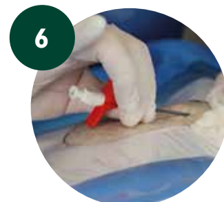
6 Introducir microintroducir y retirar guía