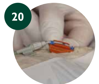
20 Colocar la parte inferior del SAS