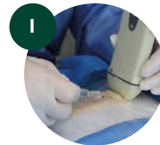
1 Anestesia local