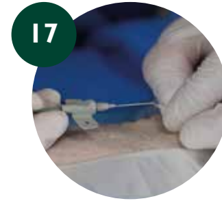
17 Conexión proximal