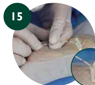
15 Pinzado y corte