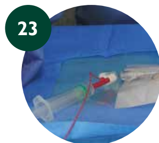
23 Volver a comprobar con ECG-IC y rectificar medida interna si es necesario