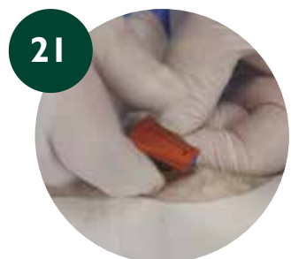
21 Colocar parte superior del SAS sobre la inferior y cerrar el SAS