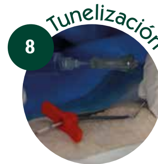
8 Crear habón