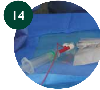
14 Volver a comprobar con ECG-IC y rectificar medida interna si es necesario