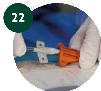
22 PICC proximal - SAS