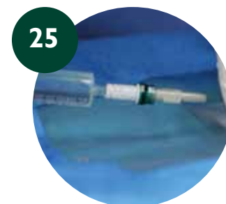
25 Lavado y sellado