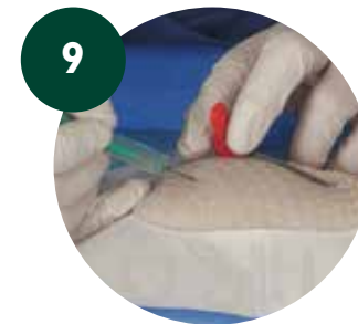
9 Realizar una incisión en la zona de salida del catéter