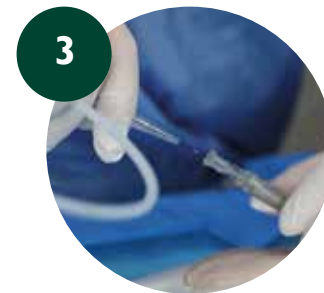
3 Introducir guía