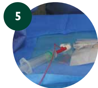
5 Comprobar punta del catéter con ECG-IC