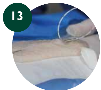
13 Conectar PICC al tunelizador y sacar el catéter por el Exite Site