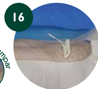
16 Corte proximal