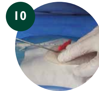
10 Introducir el tunelizador