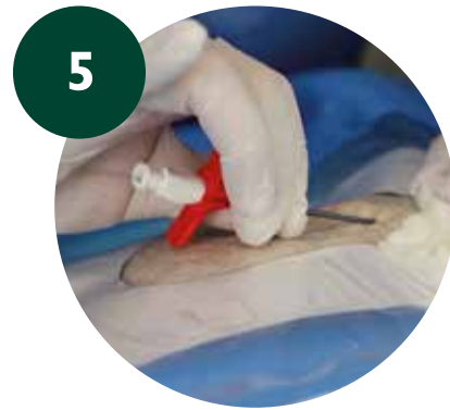
Introducir microintroducer y retirar dilatador y guía