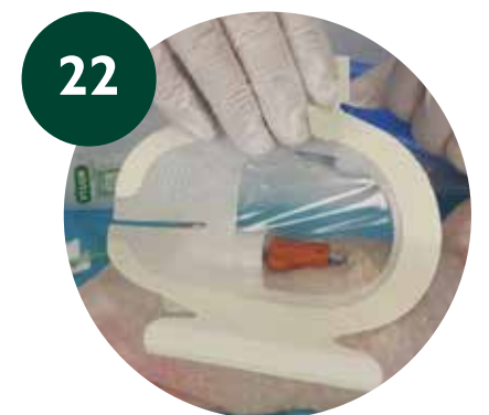
Estabilización del PICC y protección del Exit Site