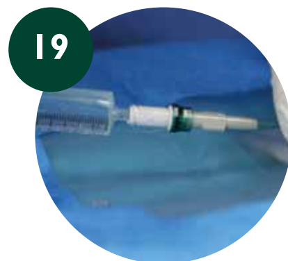
Lavado y sellado