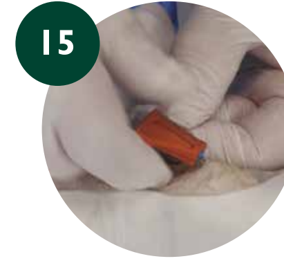
Colocar parte superior del SAS sobre inferior y cerrar SAS