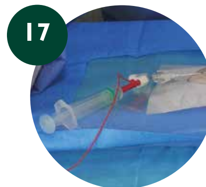
Comprobar punta del catéter con ECG-IC