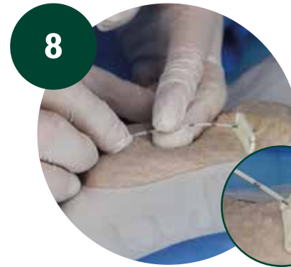
Pinzado y corte