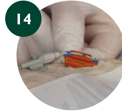
Colocar la parte inferior del SAS