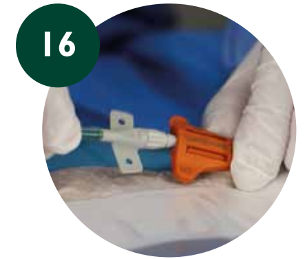
PICC proximal - SAS